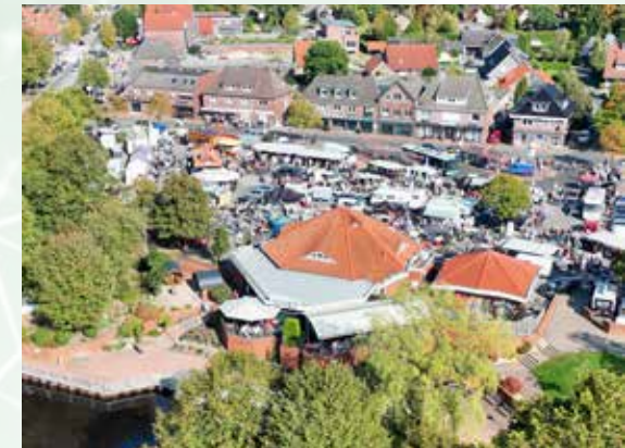
Der Marktplatz war bei vielen Aktivitäten der zentrale Treffpunkt.

Wir bedanken uns bei allen Unternehmen, Ver-