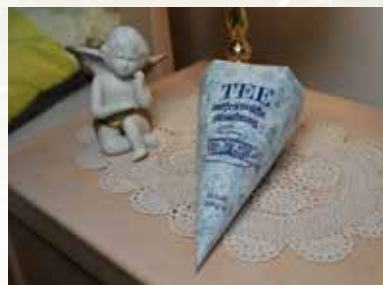
Vielen Dank an die Firma Uwe Rolf, Ostfriesische Teekultur in Aurich, für die Überlassung der Spitztüten mit echtem ostfriesischen Tee.

später zogen sie zu Verwandten nach Düsseldorf. Ihr Sohn Hermann wuchs schnell heran und jedes Jahr, am Heiligen Abend, erzählten seine Eltern ihm die schöne Geschichte, mit der Spitztüte Tee aus Wiesmoor. Hermann war längst erwachsen geworden, hatte geheiratet und seine Frau schenkte ihm einen Sohn und ein Mädchen. Auch trat Hermann einem sozialen Verein bei, der in bat, doch zu Weihnachten den Weihnachtsmann zu spielen und den Menschen in den umliegenden Altersheimen eine Freude zu machen. Das machte Hermann mit einer wahren Begeisterung und zum Schluss sang er mit den Senioren immer das Lied „O