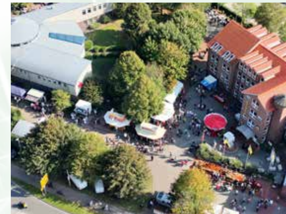
Das Kürbisfest beim Sparkassen/Rathaus-Areal lädt immer wieder zum entspannten Bummeln ein.

Die Wirtschaftsgemeinschaft WiW blickt auf ein ereignisreiches und erfolgreiches Jahr 2025 zurück. Trotz wechselhaftem Wetter war unser Frühlingsfest 2025 ein schöner Erfolg – dank der großartigen Stimmung, des engagierten Einsatzes vieler Helferinnen und Helfer sowie der guten Laune unserer Besucherinnen und Besucher, die das Beste aus dem Wetter gemacht haben.