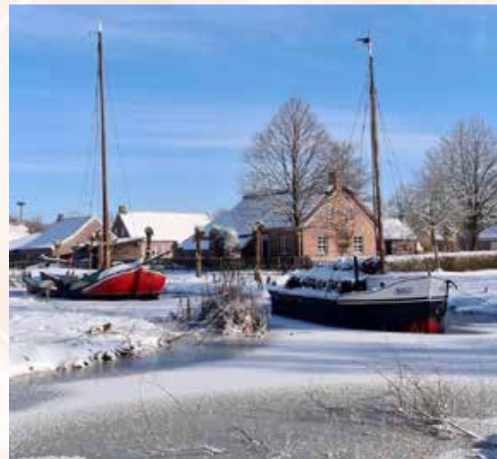
Weihnachtsstimmung an der Blumenhalle und am Torf- und Siedlungsmuseum.