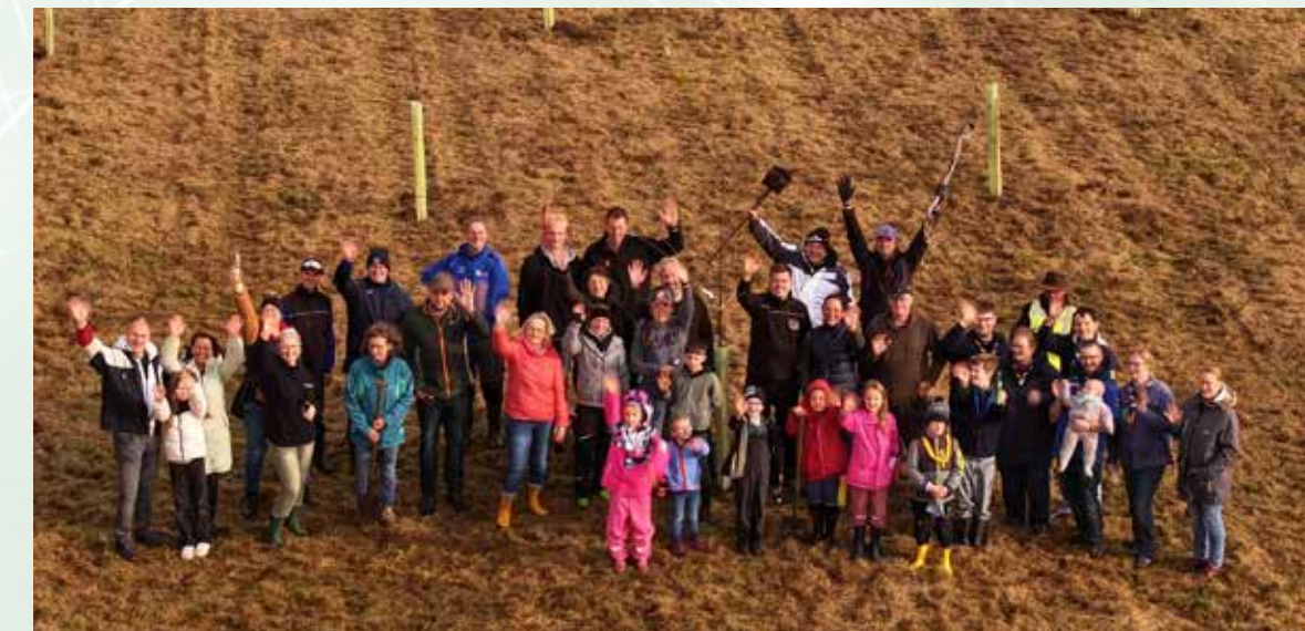
Für jedes der 130 Mitglieder wurde ein Baum gepflanzt.

einen und Bürgerinnen und Bürgern, die uns in diesem Jahr begleitet und unterstützt haben. Die Wirtschaftsgemeinschaft, kurz: WiW wünscht eine wunderbare Weihnachtszeit, besinnliche Feiertage und viel Gesundheit für das neue Jahr. Auch 2026 stehen wir den Unternehmen, Vereinen und Bürgern unserer Stadt wieder vollumfänglich zur Seite – mit neuen Ideen, Projekten und Gemeinschaftsgeist.