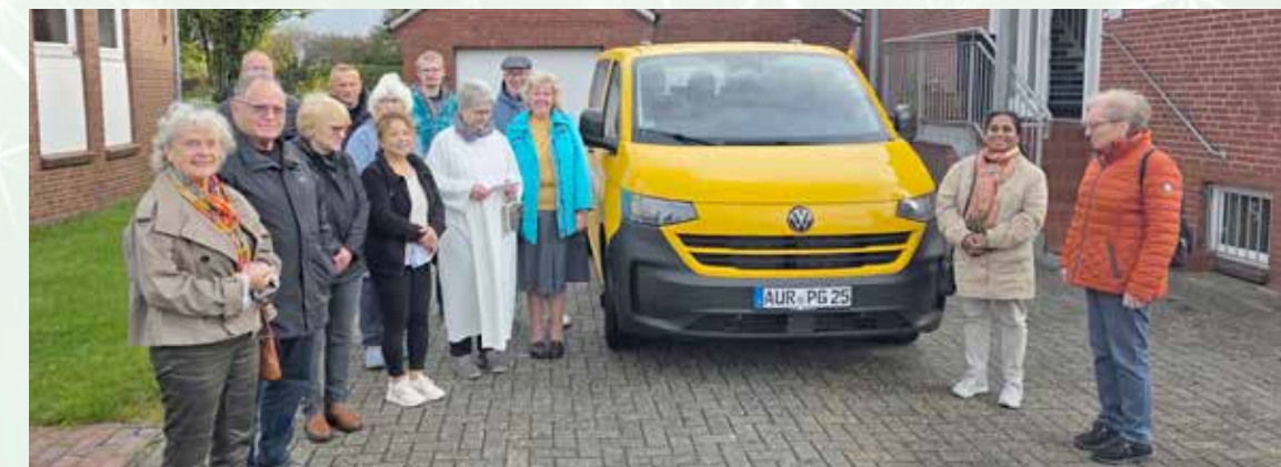
Nach dem Sonntagsgottesdienst erhielt der neue Bulli einen Segen und ist damit „offiziell“ in Dienst gestellt.

ausgeliehen werden, wenn er nicht im Gemeindeeinsatz ist. Interessierte können sich dazu im Pfarrbüro melden.