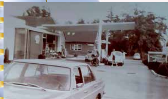
Die Tankstelle wurde im Mai 1969 erworben.

Das Jahr 1975 markiert einen bedeutenden Meilenstein in der Geschichte des Autohauses Gebr. Decker: Vor 50 Jahren wurde der Händlervertrag mit Toyota Deutschland geschlossen. Heute blickt die Familie Decker mit Stolz auf eine beeindruckende Entwicklung zurück und feiert ein halbes Jahrhundert Partnerschaft mit Toyota.