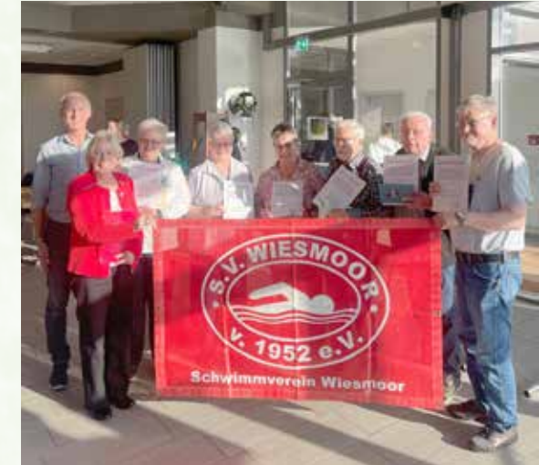
Ehrung auf der JHV des Schwimmvereins Wiesmoor.