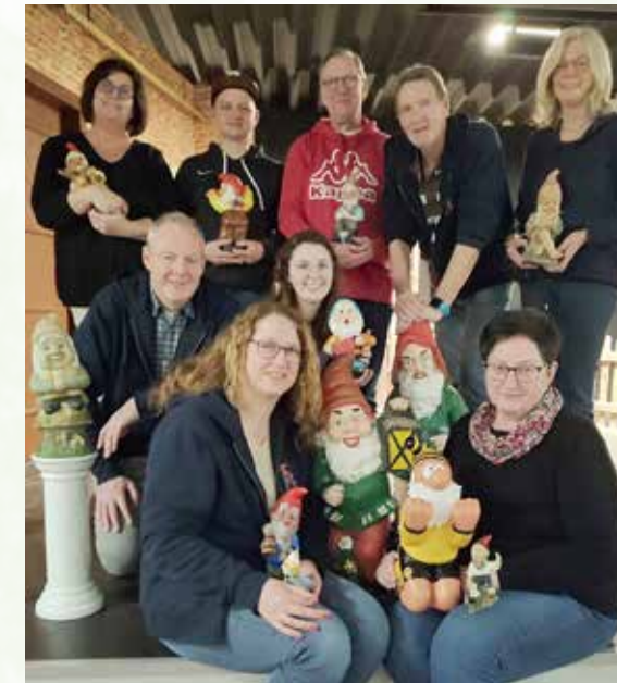
Das Ensemble von „Spektakel bi Chrischan“ freut sich auf die Aufführungen im März und April.

In dem Dreiakter geht es um Christian Veddern, der von allen nur „Chrischan“ genannt wird.