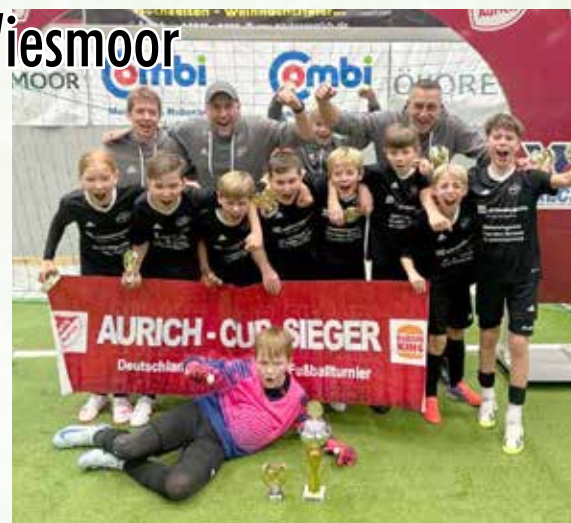
Herzlichen Glückwunsch an die E-Junioren!

In den Viertelfinalspielen trafen die Teams aus unserer Blumenstadt auf jeweils sehr starke