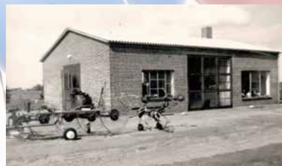
Am 1.12.1966 wurde die Landmaschinenwerkstatt gegründet.

Als Hybridspezialisten mit 25 Jahren Erfahrung bietet das Autohaus ein umfassendes Serviceangebot. Zusätzlich profitieren die Kunden von der Toyota-Relax-Garantie, die eine Garantieverlängerung von bis zu 15 Jahren & 250.000 km ermöglicht.