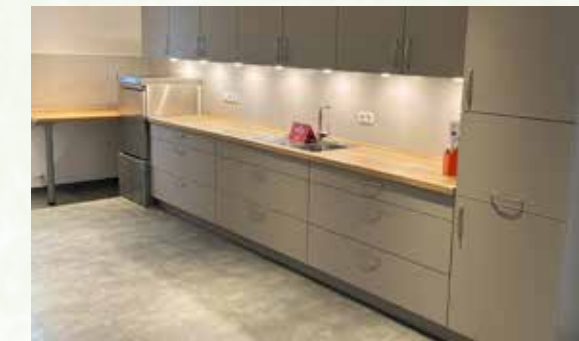
Neuer Glanz mit neuer Küche.

Ganz nach diesem Motto hat sich der Vorstand der Dorfgemeinschaft Wilhelmsfehn 2025 an die Renovierungsarbeiten der alten Küchenanlage gemacht. Bereits vor 14 Jahren wurde die Küchenanlage erweitert, um mehr Platz in diesem Bereich zu schaffen. Nun wurde es jedoch auch Zeit, die gesamte Küchenanla-