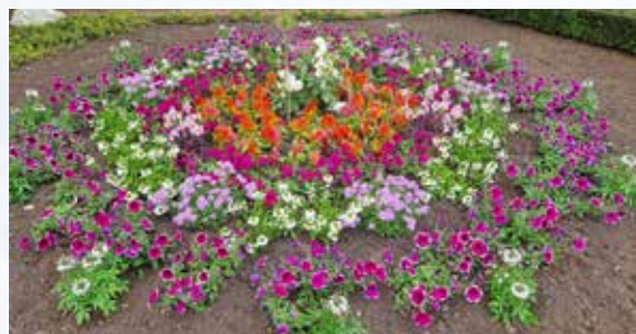
Auch dieses Beet lebt von der Vielfalt der Farben und Pflanzenarten.