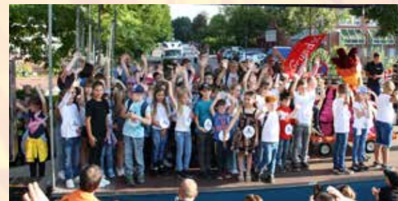
Eröffnung am Freitag.

Am Sonnabend führt Heino Krüger ab 14:30 Uhr auf der Freilicht-