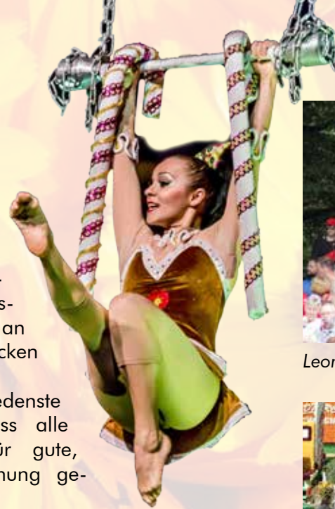
Leonies Fanclub 2023 auf der Freilichtbühne.