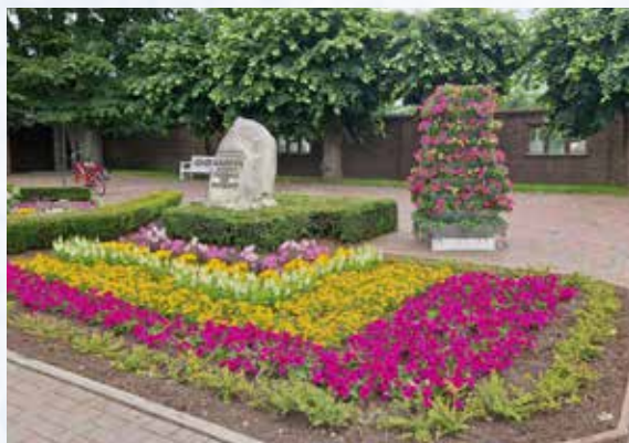
Die Bepflanzung am Ehrenmal kommt durch die größeren Beete besonders zur Geltung.

Elfriede Wehmeyer hat dem Stadtmagazin folgenden Leserbrief geschickt: