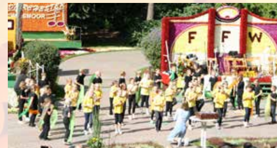
Festprogramm am Sonntag.

bühne durch die Darbietungen der Wiesmoorer Kindergärten und Schulen. Es ist jedes Jahr aufs Neue erstaunlich, bewundernswert und überraschend, was die Kinder zusammen mit ihren Kindergärtnerinnen und Kindergärtnern, ihren Lehrerinnen und Lehrern auf die Bühne bringen. Alle Blütenwagen sind zu sehen, außerdem mehrere Oldtimer, mit denen das Königshaus ab 15 Uhr von Dorfgemeinschaft zu Dorfgemeinschaft fährt, um sich zu verabschieden. Die Fahrt endet beim Dämmerchoppen im Stadion, wo bis 3 Uhr, bei viel Musik im Festzelt und unter freiem Himmel, gefeiert wird. Ab 22 Uhr wird das Höhenfeuerwerk gezündet und ab 22:15 Uhr öffnet die Open-Air-Disco MOOR:OF:ROCK im hinteren Stadionbereich.