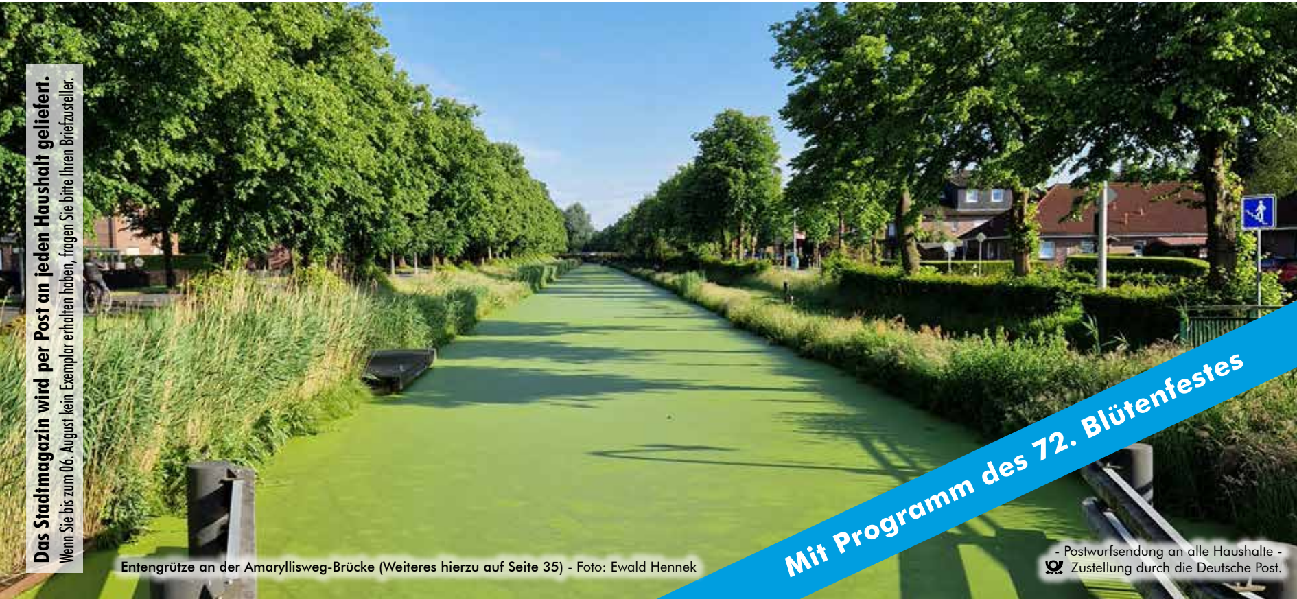
Entengrütze an der Amaryllisweg-Brücke (Weiteres hierzu auf Seite 35)

Das Stadtmagazin wird per Post an jeden Haushalt geliefert. Wenn Sie bis zum 06. August kein Exemplar erhalten haben, fragen Sie bitte Ihren Briefzusteller.