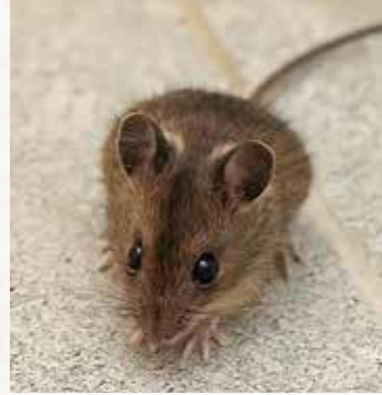
Die kleine Maus Agathe in unserem Bad.

Wir wohnen inmitten einer wunderschönen Natur und freuen uns über so manches Getier, das wir bei uns ums Haus haben. Rehe, Hasen, Vögel jeglicher Art, Eichhörnchen, aber auch Igel und Mäuse. So sah ich letztens, gerade noch aus dem Augenwinkel heraus, wie eine kleine Maus durch unser Schlafzimmer sauste. Das erzählte ich meiner Frau. Bei dem Wort Maus stand sie kerzengerade auf dem Bett. „Hier bleibe ich nicht eine Sekunde länger, ich schlafe ab sofort im Zimmer oben“, war ihre Reaktion. Im