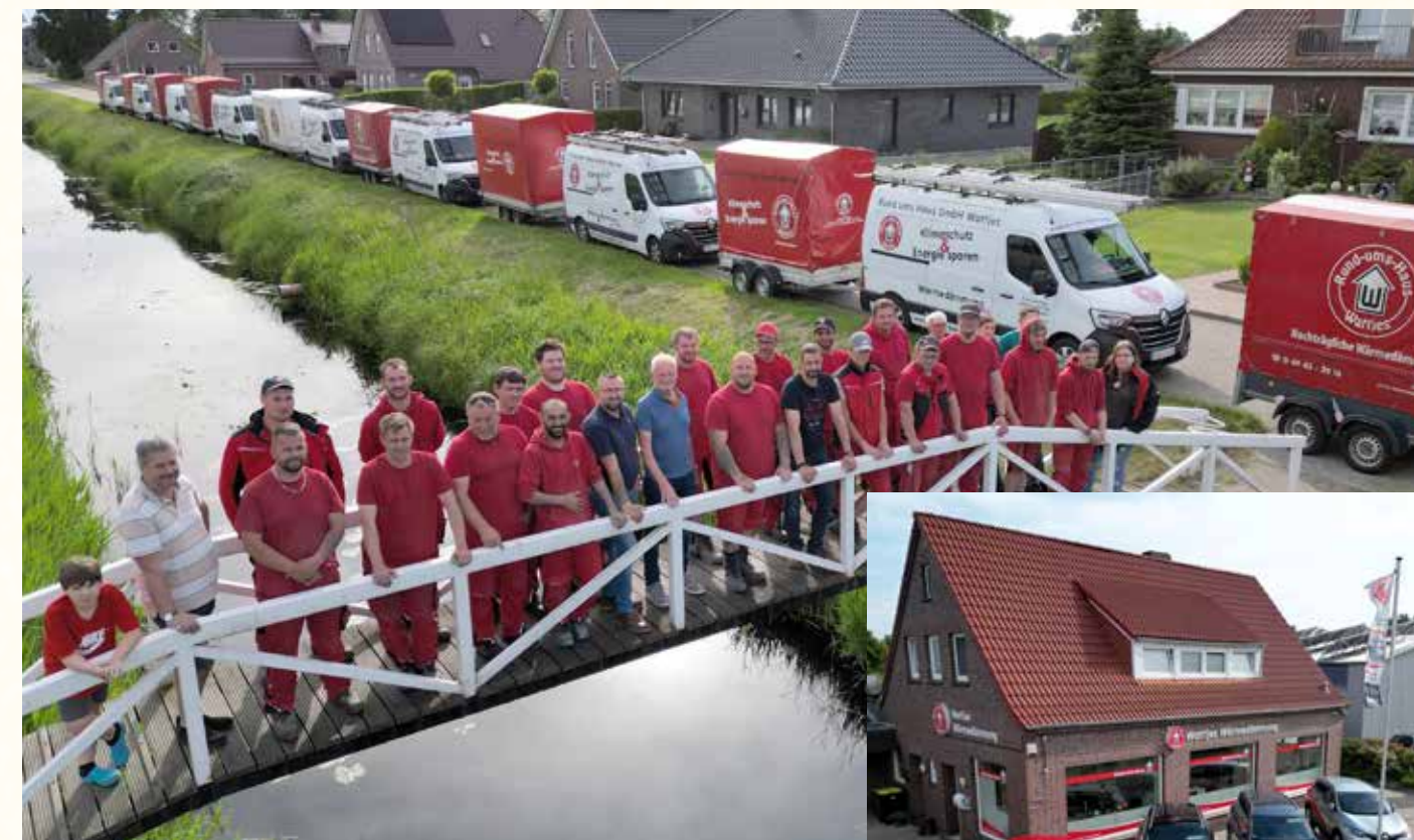
Das Team der Firma Rund ums Haus Wattjes ist erst zufrieden, wenn Sie als Kunde zufrieden sind.

Basis unseres Erfolgs sind unsere qualifizierten und motivierten Mitarbeiter. Durch intensive Schulungen haben sie alle einen Informationsvorsprung. Auf der Grundlage regelmäßiger Weiterqualifikation haben wir unsere Angebotspalette – von der Einblasdämmung ausgehend – auf sämtliche Wärmedämmarbeiten sowie viele weitere Arbeiten im Zusammenhang mit der Sanierung älterer Häuser erweitert. Denn: Ist der Dachboden erst einmal gedämmt, denken viele Hausbesitzer auch über eine Nutzung des Dachgeschosses als Wohnraum nach.