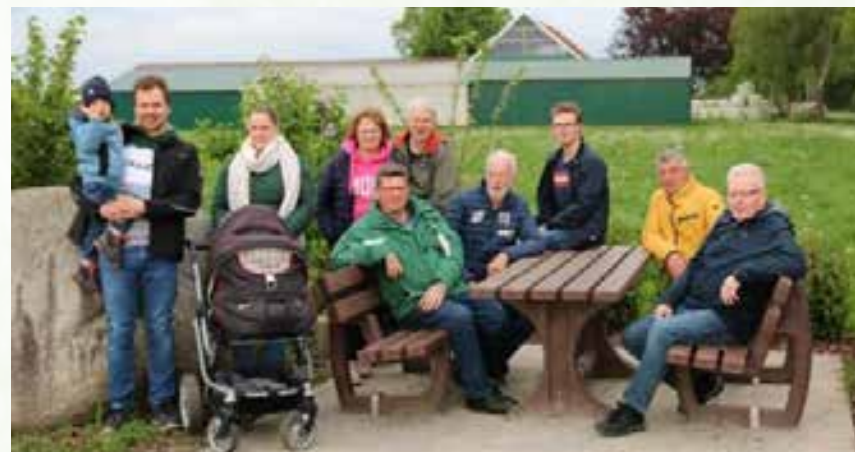
Die Bank lädt zum Verweilen ein.

gestellt wurde und sie darüber hinaus noch zusammen mit der Dorfgemeinschaft und dem Boßelverein mit großem Einsatz an der Fertigstellung mitwirkte. Allen ehrenamtlichen Helfern gilt ein besonderer Dank, haben sie doch dazu beigetragen, dass nun viele Besucher hier eine gemütliche Pause einlegen können. Die