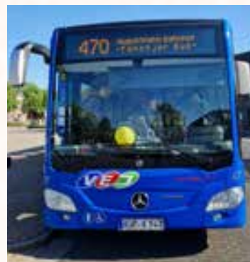
Der Fehntjer Bus auf dem Busbahnhof in Wiesmoor.

sachsen zu bekommen. Auch für Jugendliche ist es eine tolle Möglichkeit, spontan einen Tagesausflug in die näher gelegenen Städte zu machen. Der Fehntjer Bus fährt von montags bis samstags im 2-Stunden-Takt Richtung Augustfehn und natürlich zurück. Die erste Fahrt startet morgens um 6.10 Uhr in Wiesmoor, zurück geht der letzte Bus ab Augustfehn um 19.15 Uhr. Der Bus hält unter anderem am Rathaus in Remels und an vielen weiteren Haltestellen, wie beispielsweise am Gewerbegebiet in Jübberde. Die Fahrzeit beträgt in etwa eine halbe Stunde und