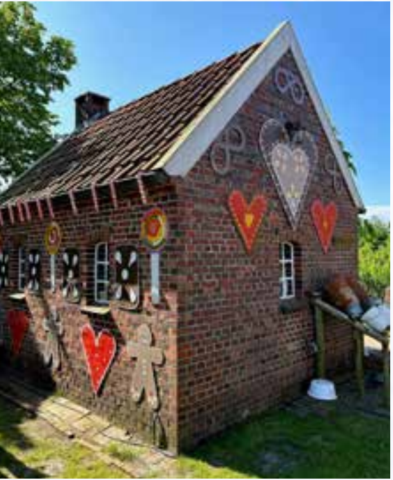
Märchenhafte Dekoration im Torf- und Siedlungsmuseum.

Auf dem Märchenfest im Museum können Kinder und Erwachsene am 2. Juni in eine magische Welt über wunderschöne Begebenheiten und spannende Abenteuer eintauchen. Sei dabei und begleite den Kasper von der Heyderhoffmann Puppenbühne auf seinen neuen, lustigen Abenteuern und fiebere mit, wenn er das listige Krokodil jagt, sich in die wunderschöne Prinzessin verliebt oder mit der Polizei Katz und Maus spielt. Verzaubern lassen kannst du dich an diesem besonderen Tag im Museum von unserem Magier Johannes. Lass dich entführen in eine Welt voller Magie und Illusionen und staune, indem du seine Zaubershow besuchst. Er ist ein wahrer „Experte für Wunder“ und in seiner Zaubershow dürfen die Kinder auch immer wieder unbedingt mitmachen, als magische Helfer die Bühne betreten oder natürlich auch selbst den Zauberstab schwingen. Also, Zau-